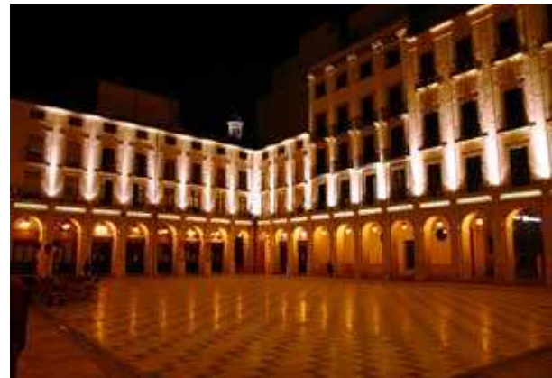
Plaza de Alcoy